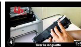
Insertion HP1566 UPrint 6 vues il y a 8 mois