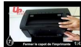
Insertion Samsung SLT2160 UPrint 8 vues il y a 8 mois