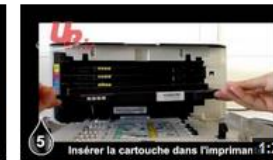
Insertion Samsung CLP 320 UPrint 9 vues il y a 8 mois