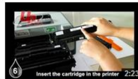
Insertion HP1215 UPrint (EN) 12 vues il y a 8 mois