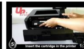
Insertion HP400 UPrint (EN) 7 vues il y a 8 mois