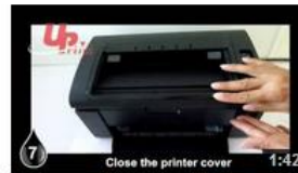
Insertion Samsung SLT2160 UPrint (EN) 12 vues il y a 8 mois

Vous pouvez également communiquer le lien vers la chaine de vidéos « UPrintinfo » sur You Tube.