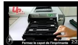
Insertion HP1215 UPrint 9 vues il y a 8 mois