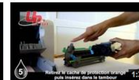
Insertion Epson EPL6200 UPrint 29 vues il y a 8 mois

http://www.youtube.com/user/UPrintinfo/videos