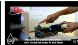
Insertion Epson EPL6200 UPrint (EN) 57 vues il y a 8 mois