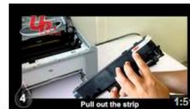
Insertion HP1566 UPrint (EN) 11 vues il y a 8 mois