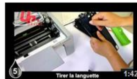
Insertion HP1566 HYBRIDE UPrint 8 vues il y a 8 mois