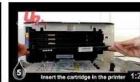
Insertion Samsung CLP 320 UPrint (EN) 21 vues il y a 8 mois